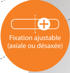
Fixation ajustable (axiale ou désaxée)