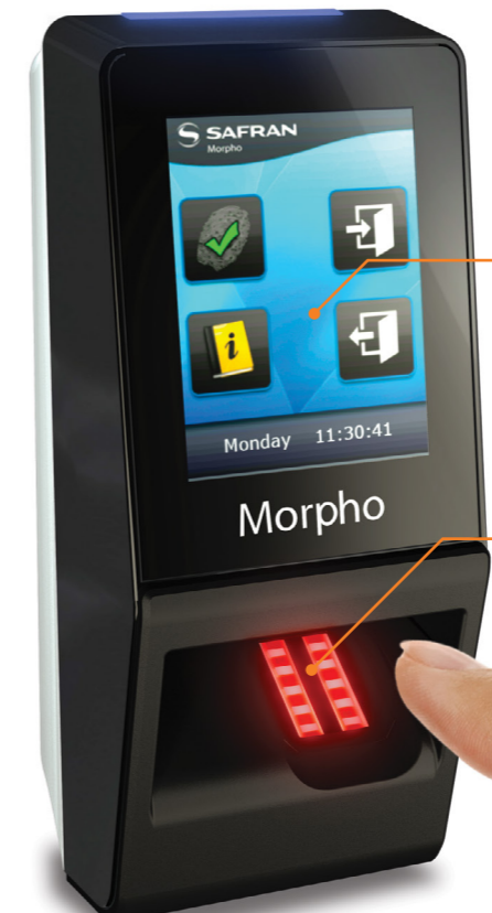
MA SIGMA Lite+ Avec écran couleur tactile QVGA 2.8" et buzzer