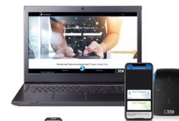
STid Mobile ID® Online Portal Plateforme Web pour une gestion à distance de vos badges virtuels