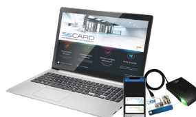
SECARD Kit de programmation SECARD et les protocoles SSCP® v1 & v2 et OSDP™